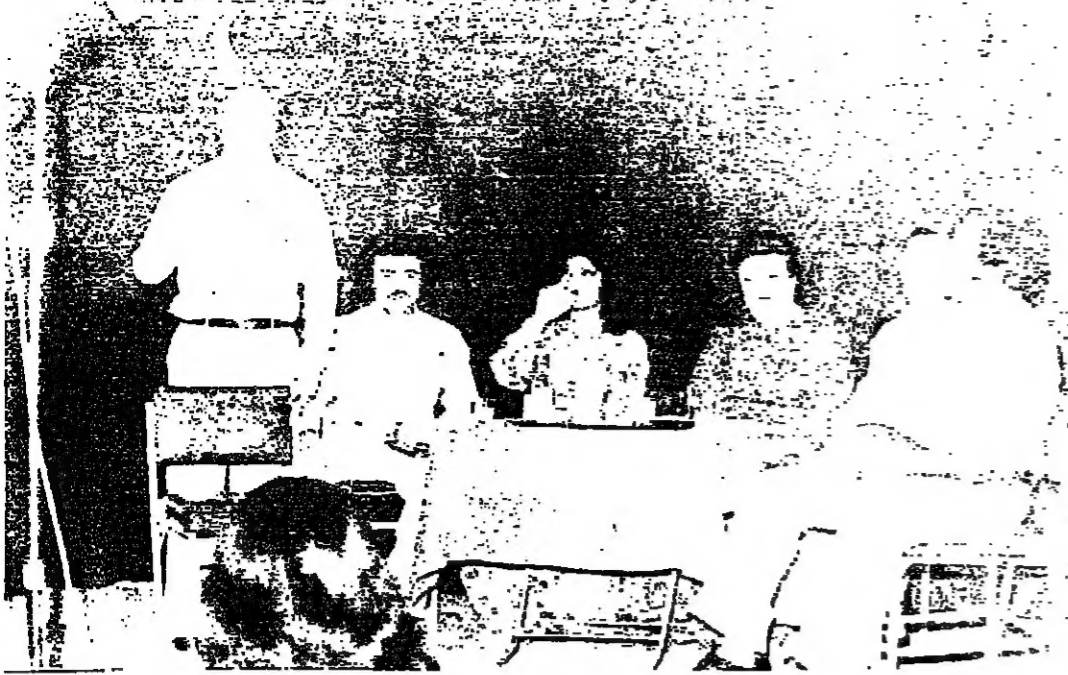
أيوب ، تيم برياري ، يفتسي ويديو السيساره ، ايبي ايوب ، تيريز كرم ، ابييت سريسق ، ايبي صنيفر ووطنوي

تضحك . العالم يضحك بكم . الطاولات ، الكراسي والجدران تسمى تاعدا في جدار الضحك . « كنا وبين وصرباوين » عمل الذي ينهض من رواده بعد خوت في لبنان ، نراه يتجلى في « ينحصر » ينطلق . لفته من صنع يديه . لشكائه من أتممة ميلين عجزتهم ورثة الخشية يلقاها والتوضوح بما . انه خيرة صلاحة لا سوف ياتي ، من أعمال رالمة متولدة ... تعيد الامانة التي سلبت عندها ، وتحاول ، الى ذلك ، خط الوراثة لاعادة نطقها من جديد على بساط المسيرة اللبنانية الثقافية وواقعها الاجتماعي العام .